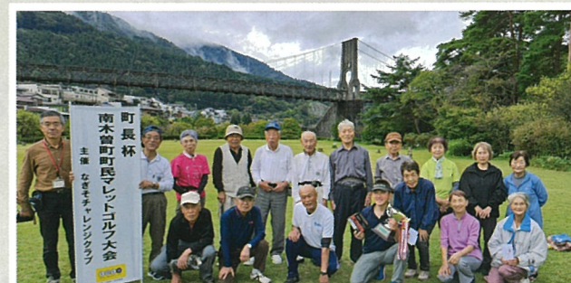
[町長杯マレットゴルフ大会]10月