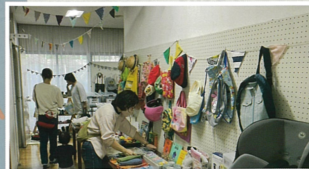
[なぎそおさがり会]5月・10月