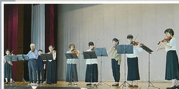
[なぎそサークル発表会2025]