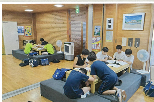
[中学校放課後子ども教室] 通年開催