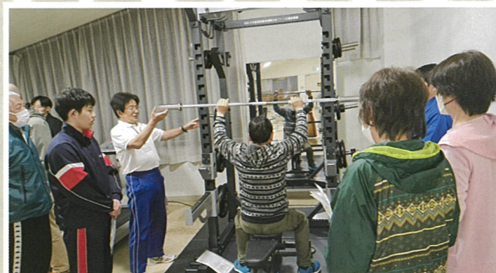
[筋トレ器具講習会]4月