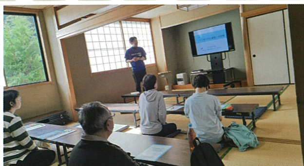
[インターバル速歩体験会]4月