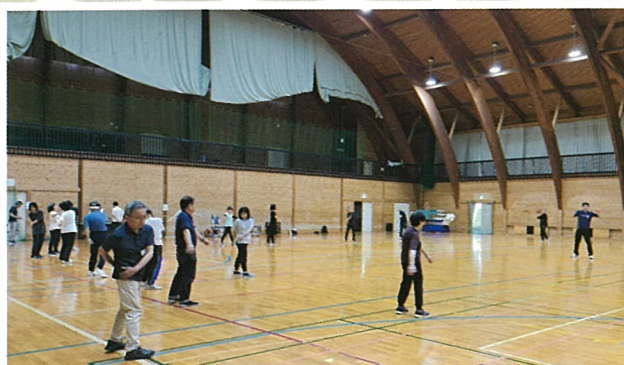
[インターバル速歩講座]6月~12月