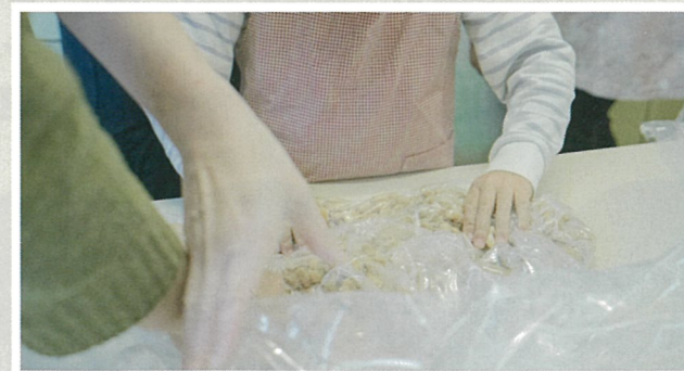
[みそ作り体験会]3月