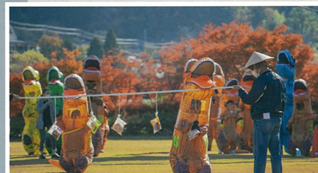
[ティラノサウルスレース]11月