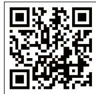
▲宿泊税のお知らせ特設サイト

※独自に宿泊税を課税予定の市町村は、税額が異なる場合があります。(松本市、軽井沢町、阿智村、白馬村、野沢温泉村)