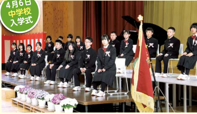
4月6日 中学校 入学式