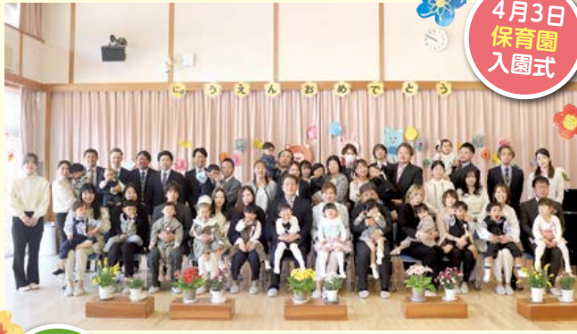
4月3日 保育園 入園式