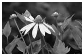
オオハンゴンソウ