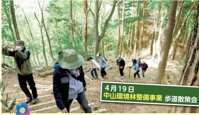
4月19日 中山環境林整備事業 歩道散策会