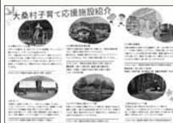
▲作成したチラシやリーフレット