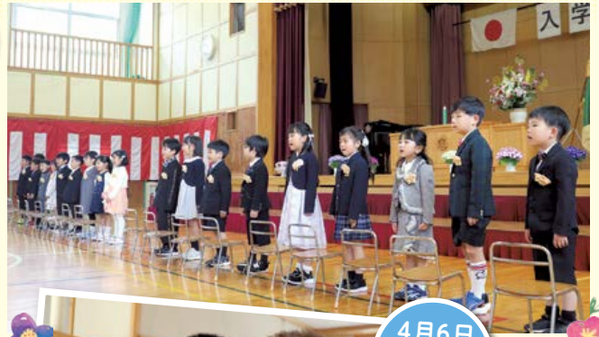
4月6日 小学校 入学式