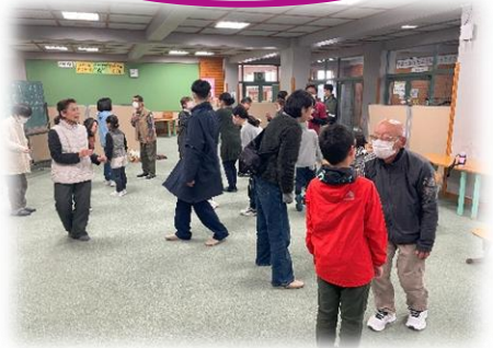
「私の好きな食べ物は“焼肉！”自己紹介がどんどん楽しくなります

四月に入り学校も新学期がスタート。早速に「わくわく人権講座」もスタートしました。この日のテーマは、「自分を表現しよう」と題し、小学生と教職員、村民の皆さんがお互いを自己紹介しました。 「私の名前は●▲です」「好きな食べ物は★■です」安心して聴いてもらえるから、安心して話せる。喜んで聴いてもらえるから、喜んで話せる。 この心温かな空間がどんどん広まり、世界中に届くといいですね。 (文：公民館主事 木下大輔)