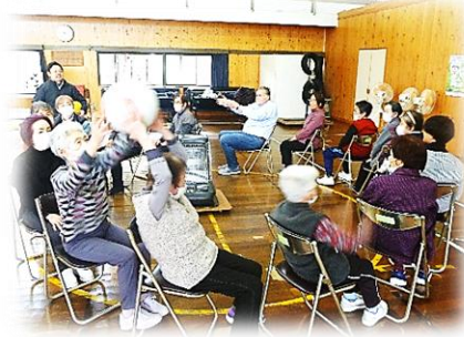
それ! 来た~!! 玉送りの体操で笑いが溢れる