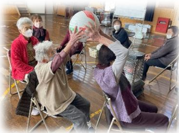
声を掛けながら後ろから前にボールを送ります。